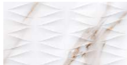
Deco Calacatta Gold 32x62,5 / 12,6"x24,6"