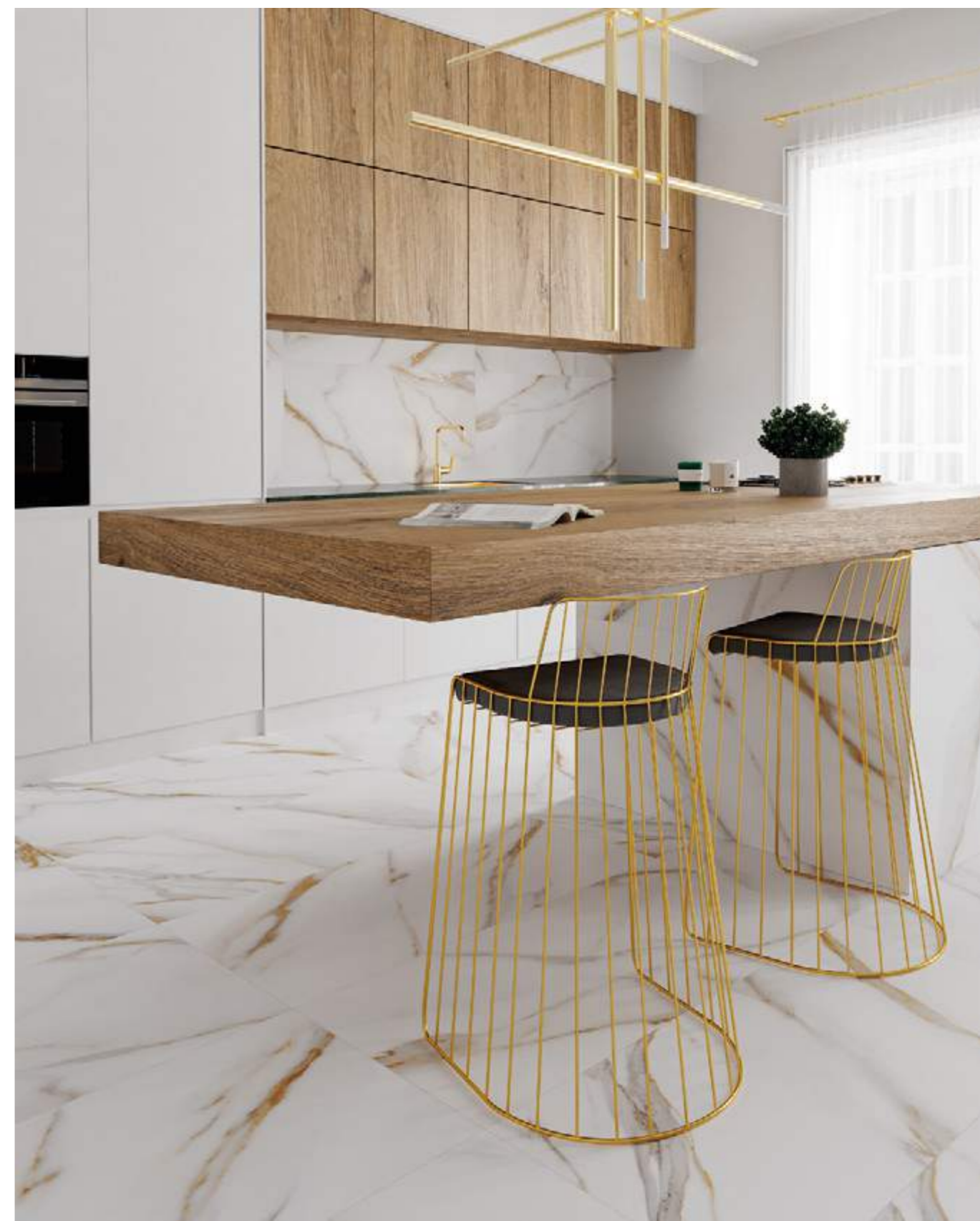
Rect. Calacatta Gold 59,1x119,1 / 23,3"x46,9"

60x120 cm / 23,6"x47,3" Rect 59,1x119,1 cm / 23,3"x46,9" 45x90 cm / 17,7"x35,5" 32x62,5 cm / 12,6"x24,6"