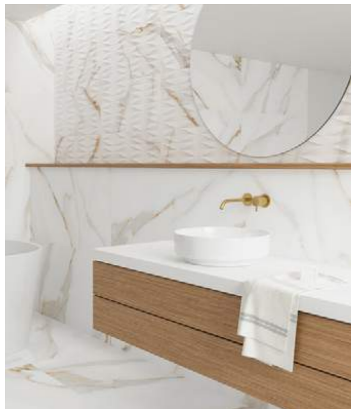
Rect. Calacatta Gold 59,1x119,1 / 23,3"x46,9" · Deco Calacatta Gold 32x62,5 / 12,6"x24,6"