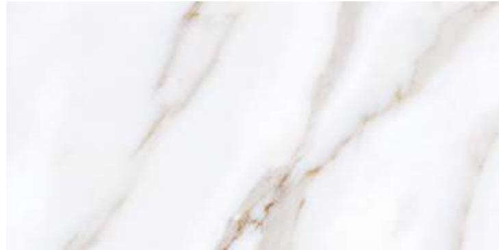
Rect. Calacatta Gold 59,1x119,1 / 23,3"x46,9" Calacatta Gold 60x120 / 23,6"x47,3"

60x120 cm / 23,6"x47,3" Rect 59,1x119,1 cm / 23,3"x46,9" 45x90 cm / 17,7"x35,5" 32x62,5 cm / 12,6"x24,6"