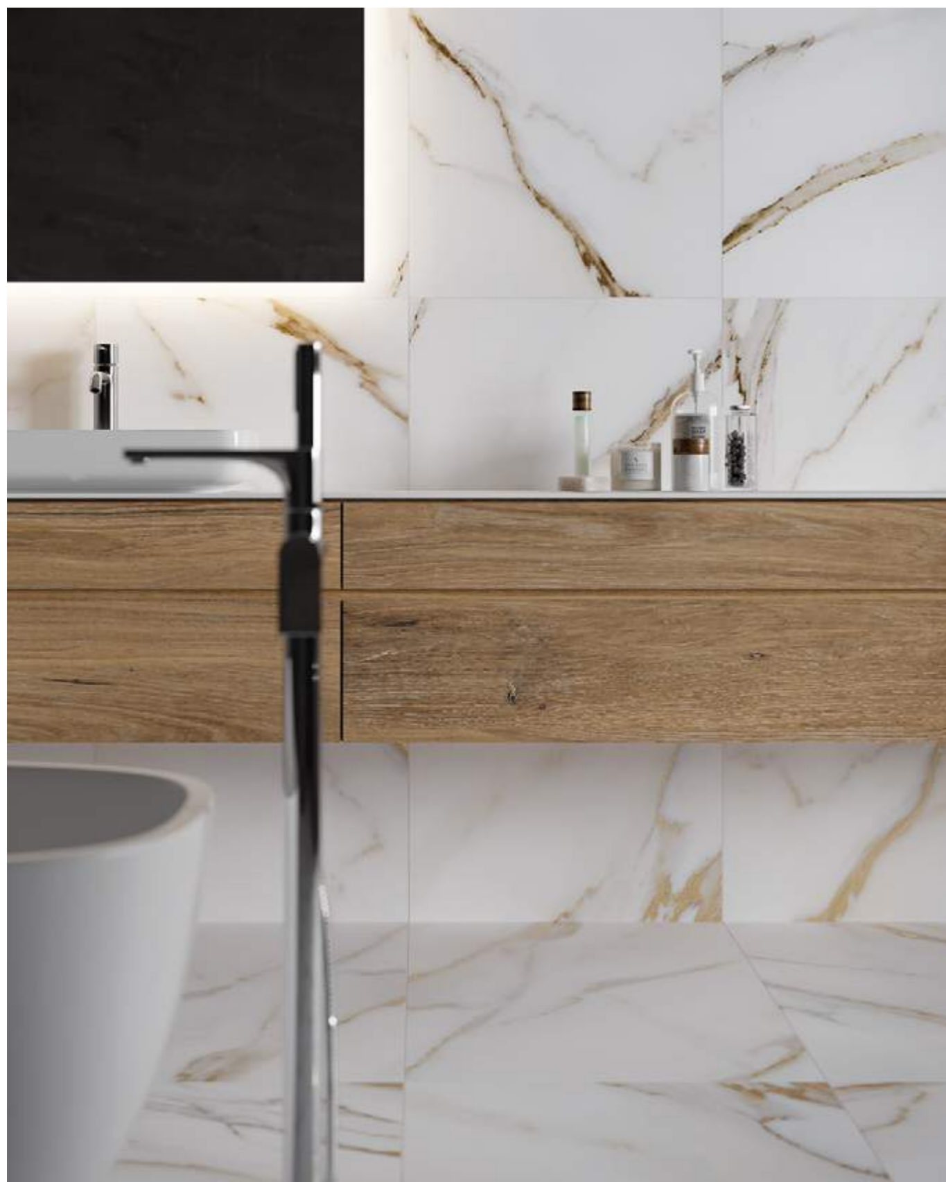
Rect. Calacatta Gold 59,1x119,1 / 23,3"x46,9"

MÁRMOL | PORCELÁNICO ESMALTADO MARBLE | GLAZED PORCELAIN TILES MARBRE | GRES CERAME EMAILLÉ MARMOR | GLASIERTES FEINSTEINZEUG МРАМОРА | КЕРАМОГРАНИТ