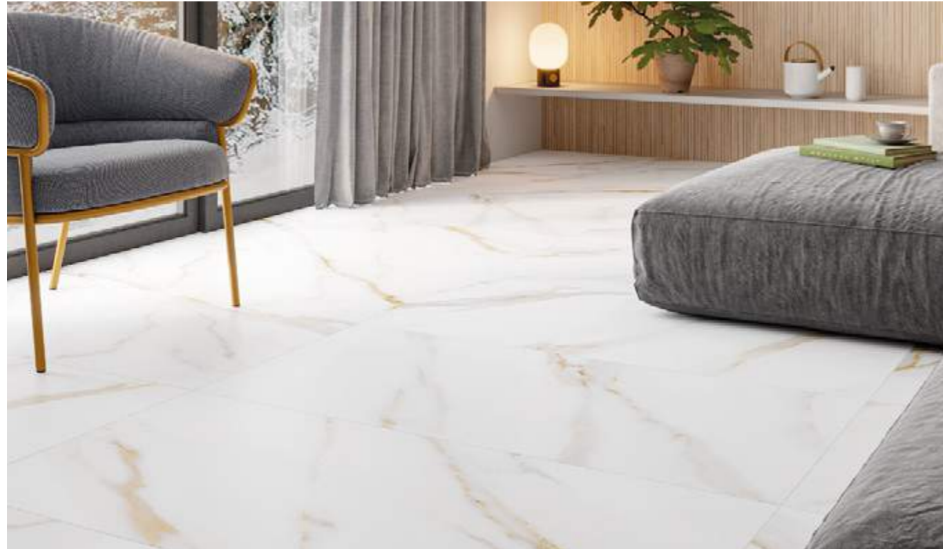
Rect. Calacatta Gold 59,1x119,1 / 23,3"x46,9"

60x120 cm / 23,6"x47,3" Rect 59,1x119,1 cm / 23,3"x46,9" 45x90 cm / 17,7"x35,5" 32x62,5 cm / 12,6"x24,6"