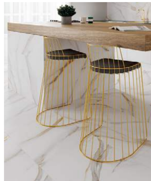
Rect. Calacatta Gold 59,1x119,1 / 23,3"x46,9"