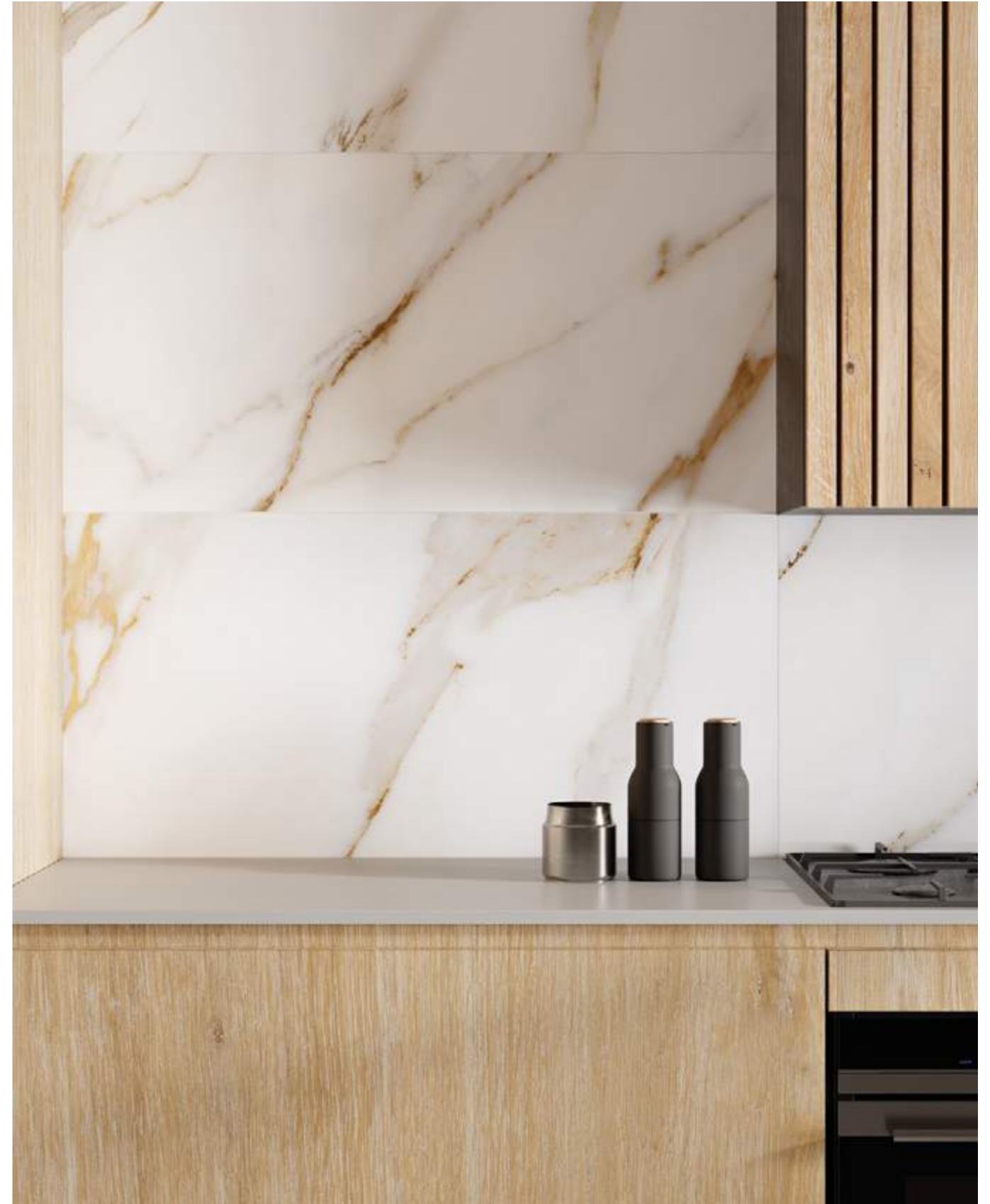
Rect. Calacatta Gold 59,1x119,1 / 23,3"x46,9"