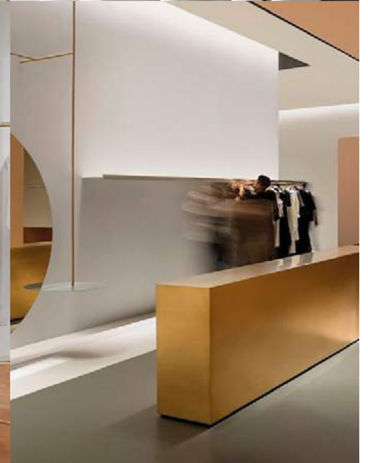
1 Reception desk, Landream's Melbourne office, designed by Miriam Fanning · 2 Handheld Tieback, from Anthropologie 3 Alice McCALL at Miranda Store by Studio Wonder, Sydney · 4 1WOR flagship store in Shenzhen, designed by Ann Yu, architect from Domani