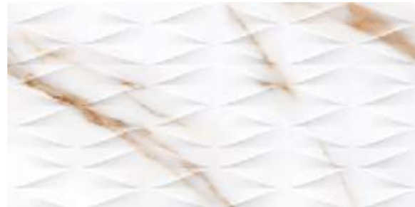
Deco Calacatta Gold 45x90 / 17,7"x35,5"