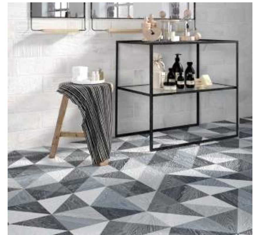
Taco Melange Black 16,5x16,5 / 6,5"x6,5" · Brick Brooklyn Blanco 11x33,1,5 / 4,3"x13,1"