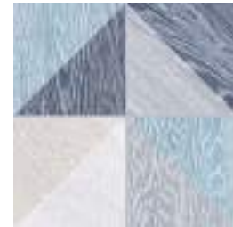
Melange Blue GF-20300D 33,15x33,15 / 13,1"x13,1"