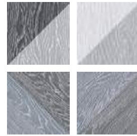
Taco GF-20305D Melange Black 16,5x16,5 cm / 6,5"x6,5"