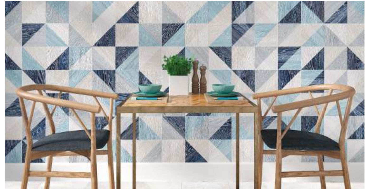
Taco Melange Blue 16,5x16,5 / 6,5"x6,5"