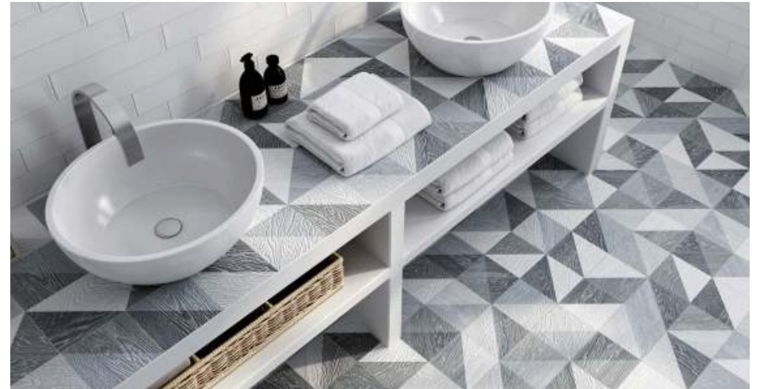
Taco Melange Black 16,5x16,5 / 6,5"x6,5" · Brick White 11x33,1,5 / 4,3"x13,1"