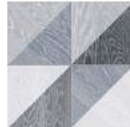
Melange Black GF-20300D 33,15x33,15 / 13,1"x13,1"