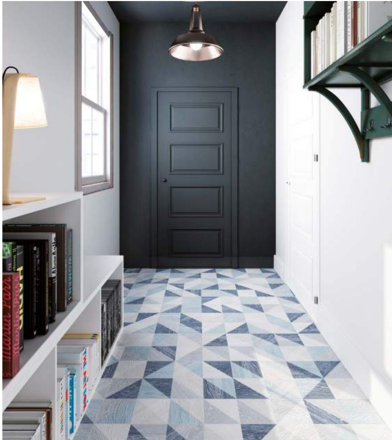
Taco Melange Blue 16,5x16,5 / 6,5"x6,5"

33,15x33,15 cm / 13,1"x13,1" 16,5x16,5 cm / 6,5"x6,5"