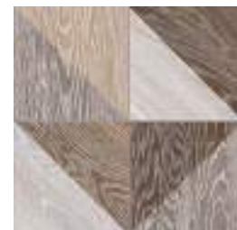
Melange Natural GF-20300D 33,15x33,15 / 13,1"x13,1"