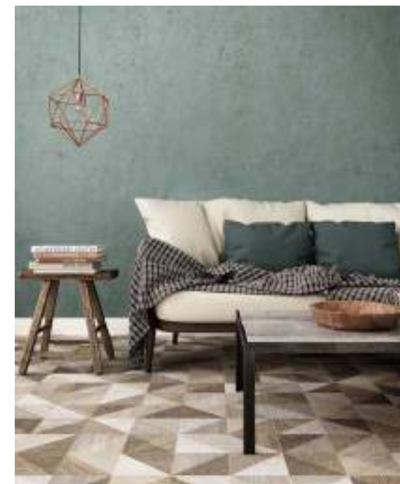
Taco Melange Natural 16,5x16,5 / 6,5"x6,5"