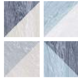
Taco GF-20305D Melange Blue 16,5x16,5 cm / 6,5"x6,5"

33,15x33,15 cm / 13,1"x13,1" 16,5x16,5 cm / 6,5"x6,5"