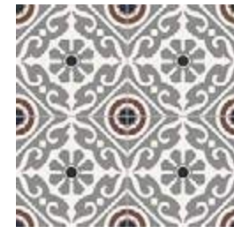
Musa Grey GF-20300D 33,15x33,15 / 13,1"x13,1"