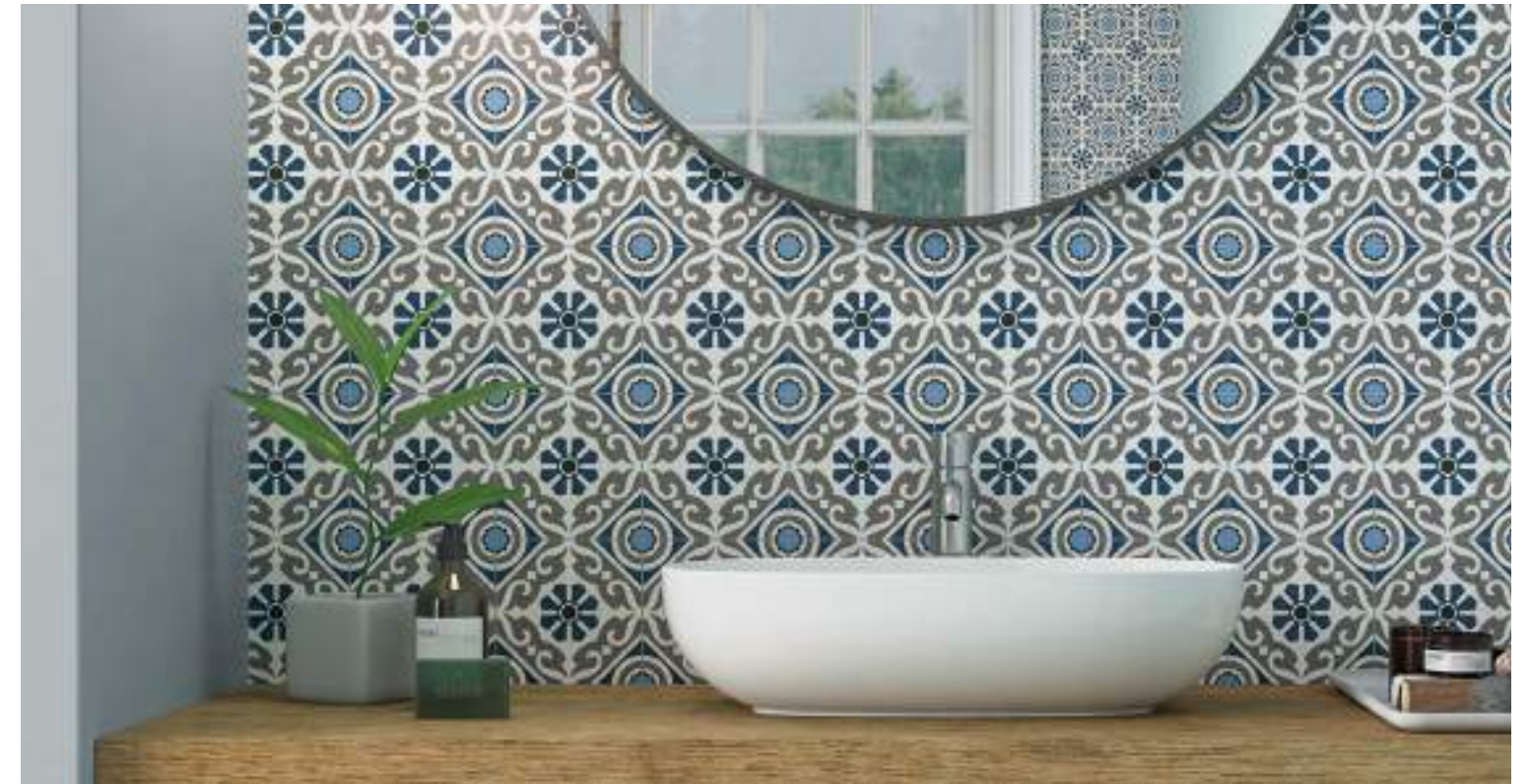
Taco Musa Blue 16,5x16,5 / 6,5"x6,5"