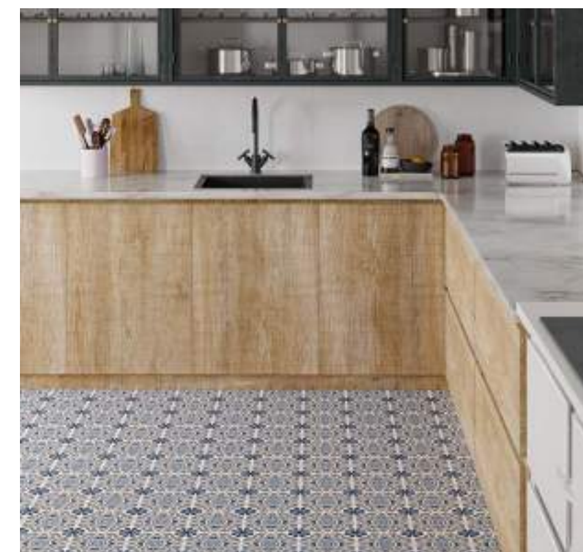
Taco Musa Blue 16,5x16,5 / 6,5"x6,5" · Brick Neutral Blanco 11x33,15 / 4,3"x13,1"