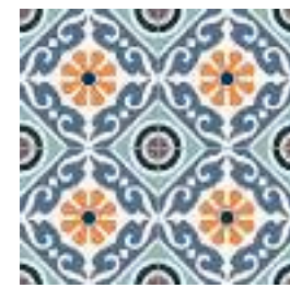
Musa Mix GF-20300D 33,15x33,15 / 13,1"x13,1"