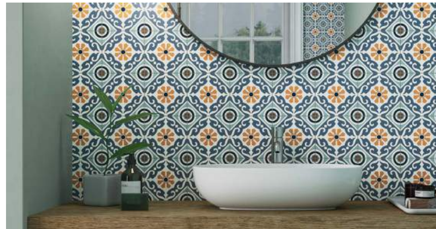
Taco Musa Mix 16,5x16,5 / 6,5"x6,5"