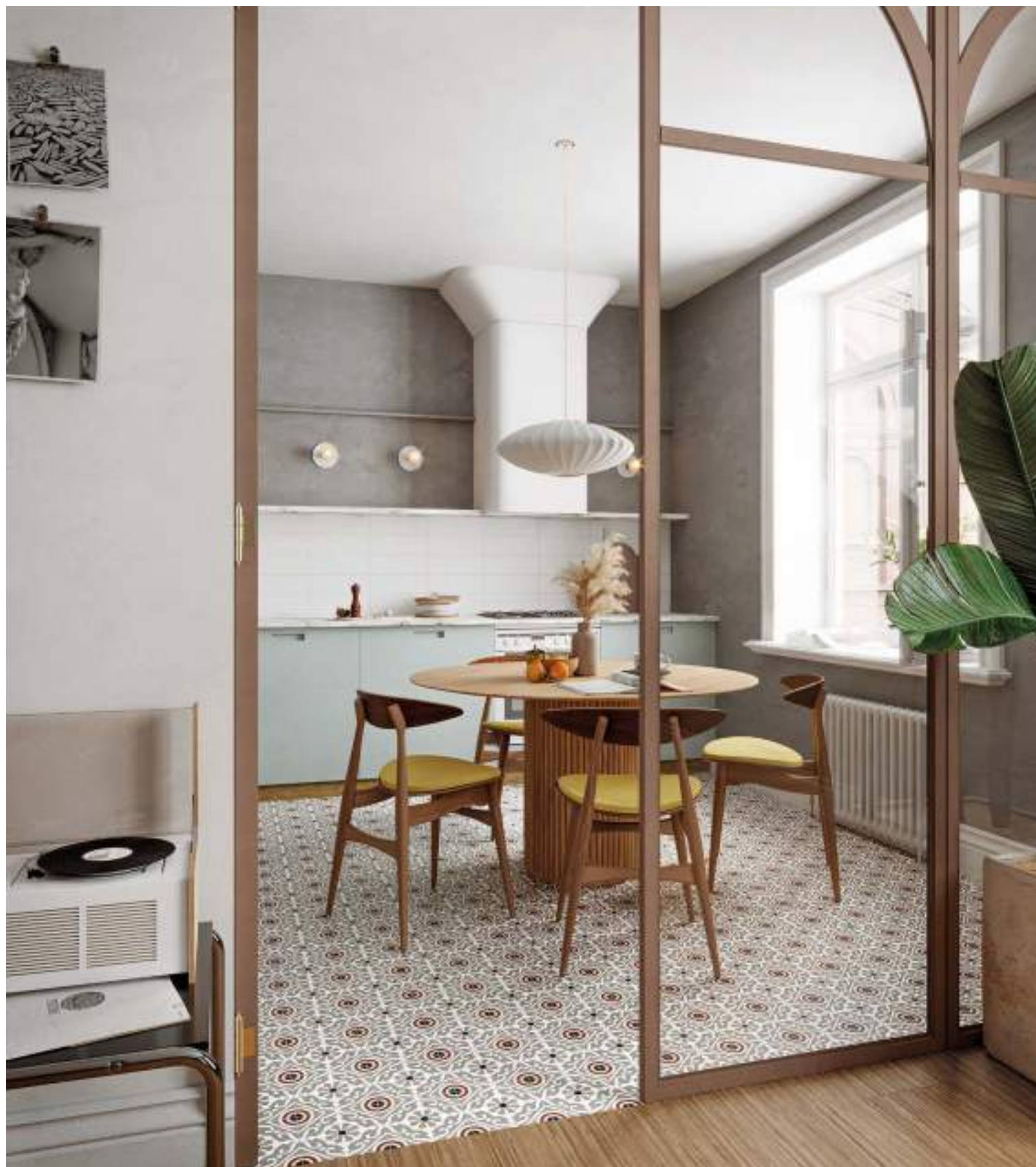
Taco Musa Grey 16,5x16,5 / 6,5"x6,5" · Lama Roble Natural 20x120 / 7,9"x47,3" · Brick Neutral Blanco 11x33,15 / 4,3"x13,1"

33,15x33,15 cm / 13,1"x13,1" 16,5x16,5 cm / 6,5"x6,5"