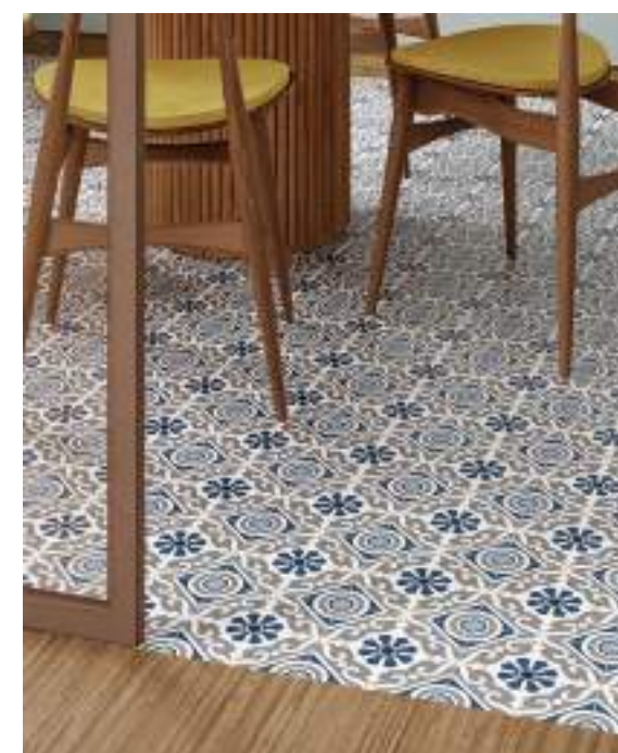
Taco Musa Blue 16,5x16,5 / 6,5"x6,5" Lama Roble Natural 20x120 / 7,9"x47,3"