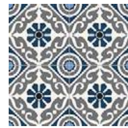
Musa Blue GF-20300D 33,15x33,15 / 13,1"x13,1"