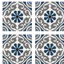
Taco Musa Blue 16,5x16,5 cm / 6,5"x6,5"